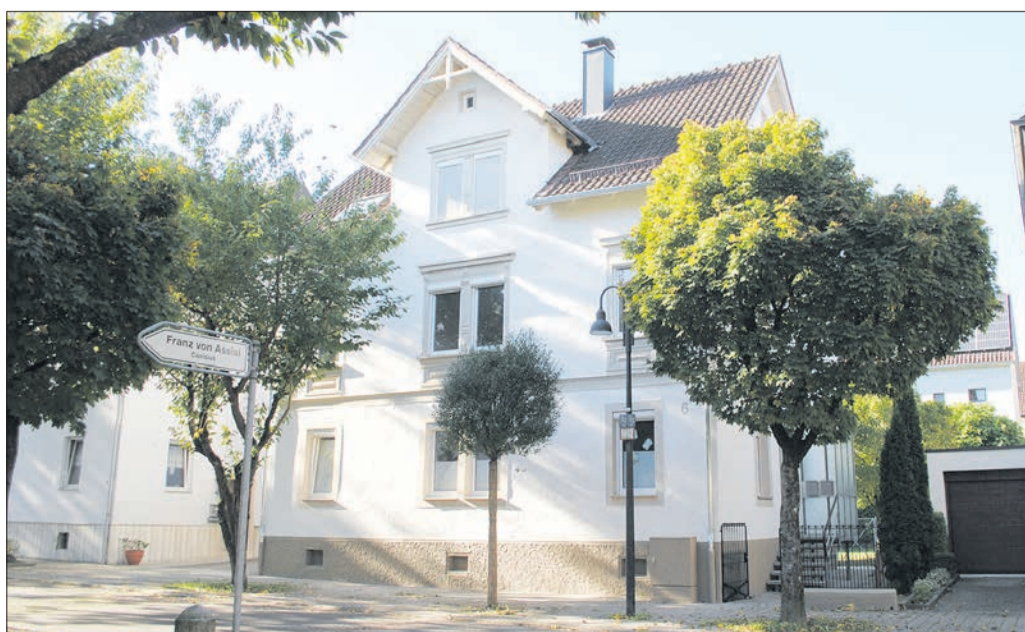
Das Gebäude Gartenstraße 6 in Gmünd. Das Büro befindet sich im ersten Stock.

Modern und trotzdem gemütlich. Ein Besprechungszimmer in den frisch renovierten Räumlichkeiten.